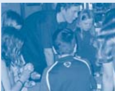
Wasserräder aus Überraschungseierschalen

100 Schülerinnen und Schüler des Schulzentrums an der Julius-Brecht-Allee und der Integrierten Stadtteilschule an der Carl-Goerdeler-Straße besuchten im März das Vitalbad Vahr und erlebten das nasse Vergnügen auf ganz neue Art: Beim Blick hinter die Kulissen erfuhren und erforschten sie Interessantes über die