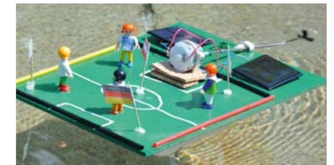
Die Frauen-Fußball-Weltmeisterschaft stand bevor, für dieses Floß gab es einen Sonderpreis!