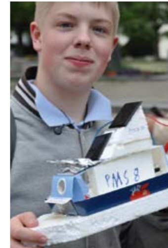
Um kreative Ideen in Bezug auf Materialien nicht verlegen

Für den Solarbootwettbewerb des Schuljahres 2010/2011 hatten sich vier Schulen mit sieben Arbeitsgruppen angemeldet. Alle Schulen hatten je Arbeitsgruppe jeweils sechs Bausätze, bestehend aus zwei gekapselten Solarzellen mit Schraubanschlüssen, Solarmotor und Stevenrohr mit Schraube erhalten. Schulen, die bereits in den vergangenen Jahren am Solarbootwettbewerb