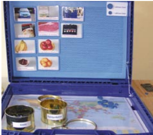
Ein Spielkoffer zu „virtuellem“ Wasser