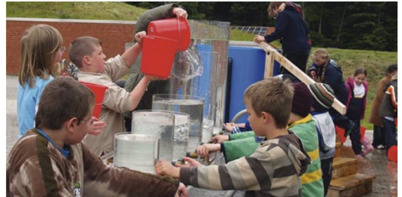
Eröffnung des Wassererlebnisplatzes am 27. Mai: Begeisterte Kinder füllen den blauen Kubikmeterbehälter mit Wasser.

Weitere Informationen: 3/4plus Bremerhaven Thorsten Maaß, Surheider Schule, Tel. 0471 / 391 39 00. familiemaass@freenet.de